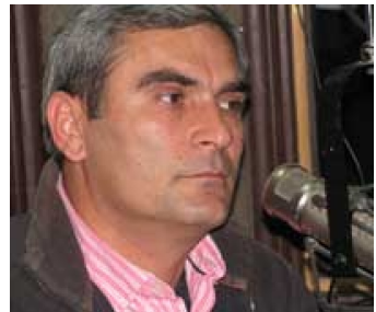
პარლამენტის აგრარული კომიტეტის თავმჯდომარე გიგლა