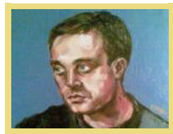
ბლოგები ლაზარეს შაბათი - ქე-ბაი და დიდებამ ქართულისა ენისაი

დადესტნელი მოჯაპედი რუსეთს მიჰყიდა? 9. ამნისტირებული პატიმრის მიერ კიდევ ერთი გაუპატიურებული - ამჯერად ხელვაჩაურში 10. ივანიშვილმა საპრეზიდენტო კანდიდატი და ოპონენტი დააპატიმრა