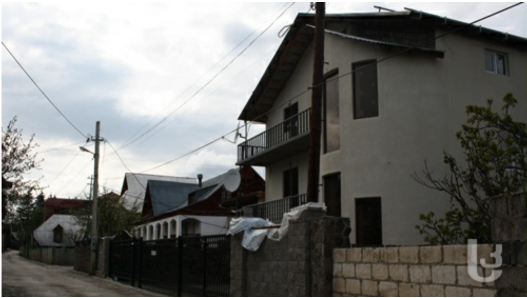
[თამუნა უჩიძე, ბორჯომი]